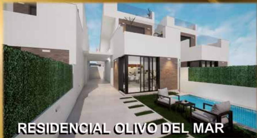
RESIDENCIAL OLIVO DEL MAR